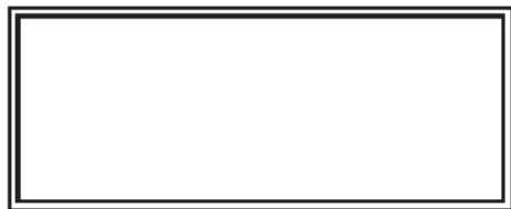
Cachet du Médecin et Signature du médecin

Rappel du règlement: le port du maillot du club est obligatoire en compétition club et championnats de France